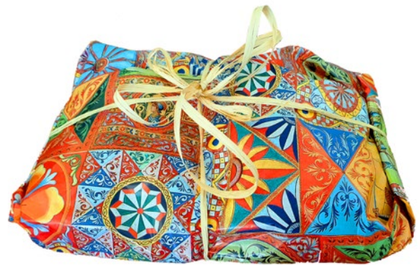
Carta da Banco per Avvolgere stampata in 3 formati