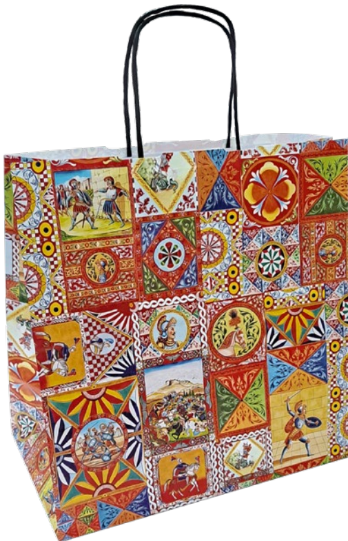
Shopper in carta Kraft