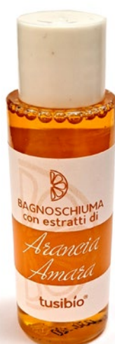
BAGNOSCHIUMA CON ESTRATTI DI ARANCIA