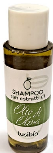
SHAMPOO CON ESTRATTI DI OLIVA