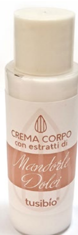
CREMA CORPO CON ESTRATTI DI MANDORLA